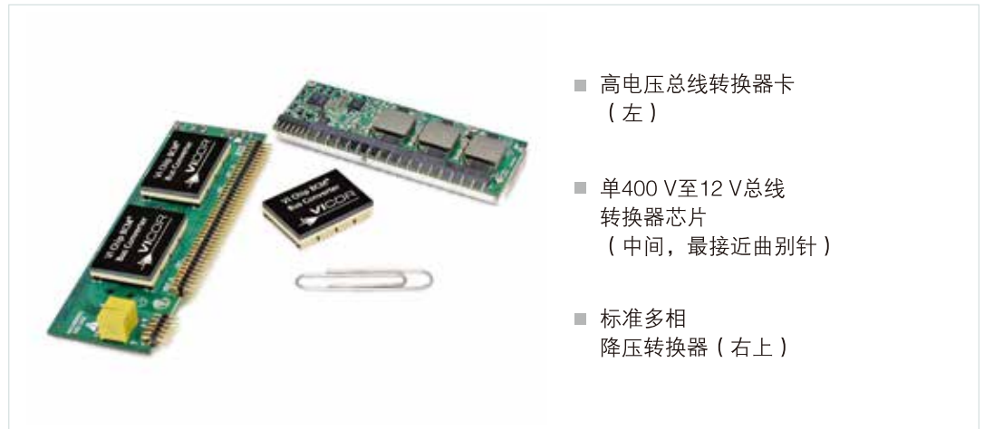
图3. 采用380VDC配电的 负载点标准解决方案实例

配电网络设计是最先进测试系统的一个挑战。它存在一些权衡，需要仔细评估选择的电源系统架构。虽然来自48V背板的分布式电源架构是今天的常见选择，诸如来自400V DC配电的分比式电源等先进架构正变得越来越有价值，因为它们可以通过提供更高的效率和更高级别的精度来提高系统密度。图3显示了一个针对400V DC配电负载点供电的标准两级设计的实例：在左边，一个前端模块包括两个400V总线转换器（在散热片下有一个靠近所示曲别针的模块）；在上部，是一个多相稳压模块（VRM），采用了经典的12 V降压转换器方法。